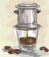
Café phin 6,00€ (+ œuf 1€)