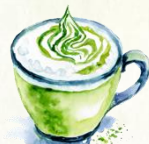
Matcha latte 4,50€