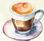
Double espresso 3,80€