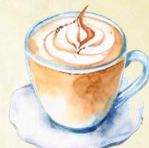
Chai latte 4,50€