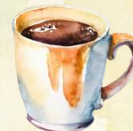
Café allongé 2,50€ (ou noisette)