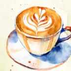
Café latte 4,00€