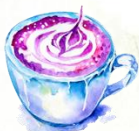
Taro latte 4,50€