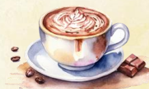
Chocolat chaud 4,00€